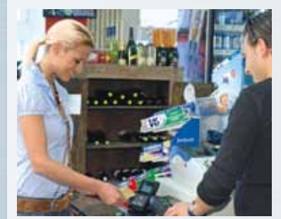
Die beste Wahl am Kiosk: Unsere schnellen Terminals garantieren noch mehr Erträge pro Minute.

«Kontaktloses Zahlen ist eine super Sache. Einfach Kreditkarte hinhalten, und in null Komma nix ist alles bezahlt. So macht Einkaufen Spass.»