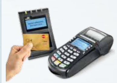
Schnell und sicher: Aduno Zahlterminals mit Kontaktlos-Funktion.