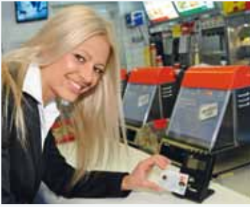
Auch bei McDonald's bezahlt man jetzt kontaktlos.