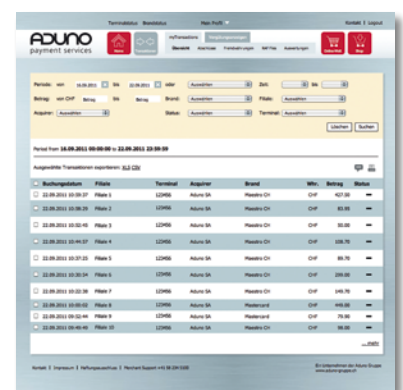
Alles mit einem Klick: Ihre Transaktionen.

myTransactions ist ein Kontroll- und Buchhaltungsmanagement-Instrument für den bargeldlosen Zahlungsverkehr in Ihrem Unternehmen. Das Tool ist ein zahlungspflichtiges Modul des kostenlosen Portals AdunoAccess. Letzteres verschafft Ihnen als Vertragspartner den vollen Überblick über Ihre administrativen Daten und alle Vergütungsanzeigen.